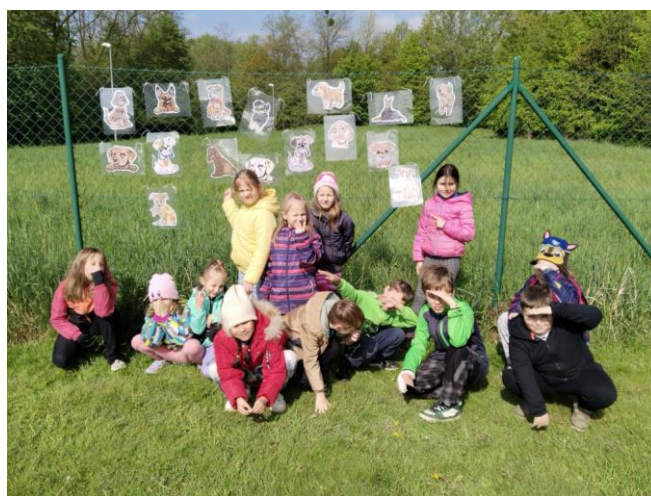
Vynášení Morany, psí útulek MAX